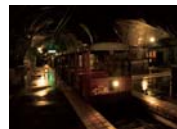
地下坑道仕込貯蔵蔵